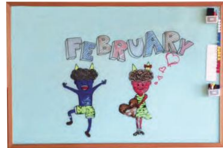
上記備品は特注対応品です。