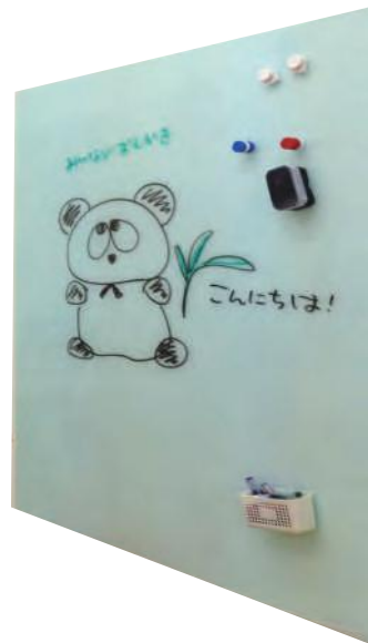
上記備品は特注対応品です。